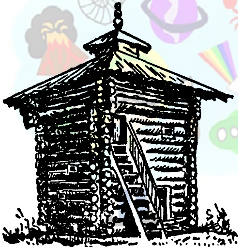
УГЛОВАЯ БАШНЯ ОСТРОГА г. БРАТСК. 1652 ГОД

Игры с предметами, экспонатами, дидактические игры, дидактическая виртуальная экскурсия. Придумывание рассказов о Братске.